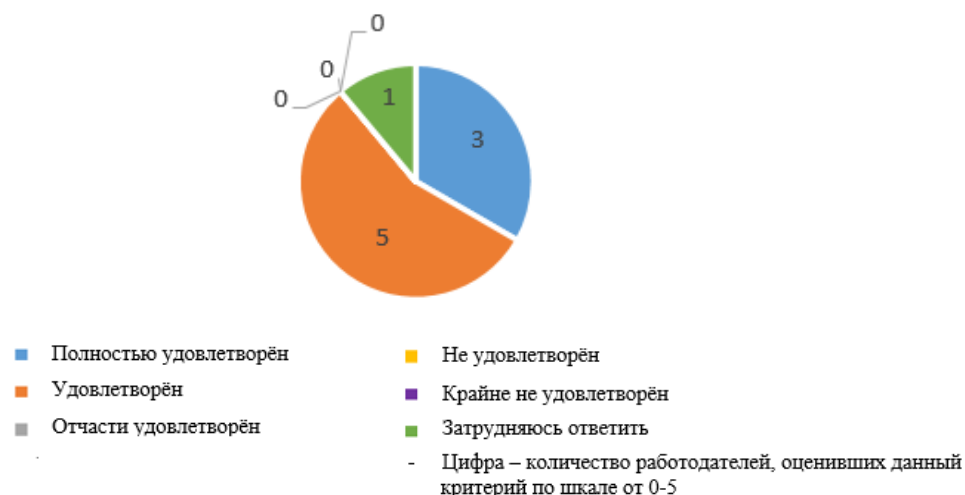
Рис. 2.7. Уровень соответствия тем выпускных квалификационных работ актуальным задачам организациям/предприятий работодателей

Достаточно высоко работодатели оценивают в обучающихся техникума все предлагаемые критерии в анкете, но на общем фоне несколько выделяется уровень коммуникативных качеств, обучающихся (практикантов/выпускников), который работодателя полностью удовлетворяет или удовлетворяет, а также уровень и способность обучающихся (практикантов/выпускников) к системному и критическому мышлению, к самоорганизации и саморазвитию, а также уровень дисциплины и исполнительности (рис. 2.8, 2.9, 2.10, 2.11).