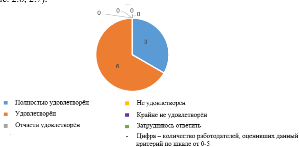
Рис. 2.6. Уровень соответствия образовательных программ/ программ практик задачам организаций/предприятий работодателей

Уровень соответствия образовательных программ/программ практик, тем выпускных квалификационных работ актуальным задачам работодателей оценен ими как полностью удовлетворительный или удовлетворительный, одна организация затруднилась в выборе ответа на данный критерий (рис. 2.6, 2.7).