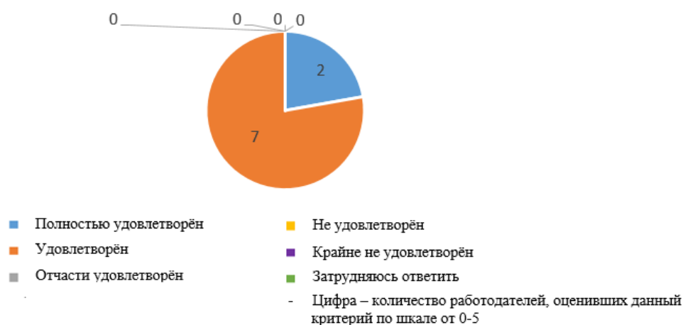
Рис. 2.9 (практикантов/выпускников) к системному и критическому мышлению