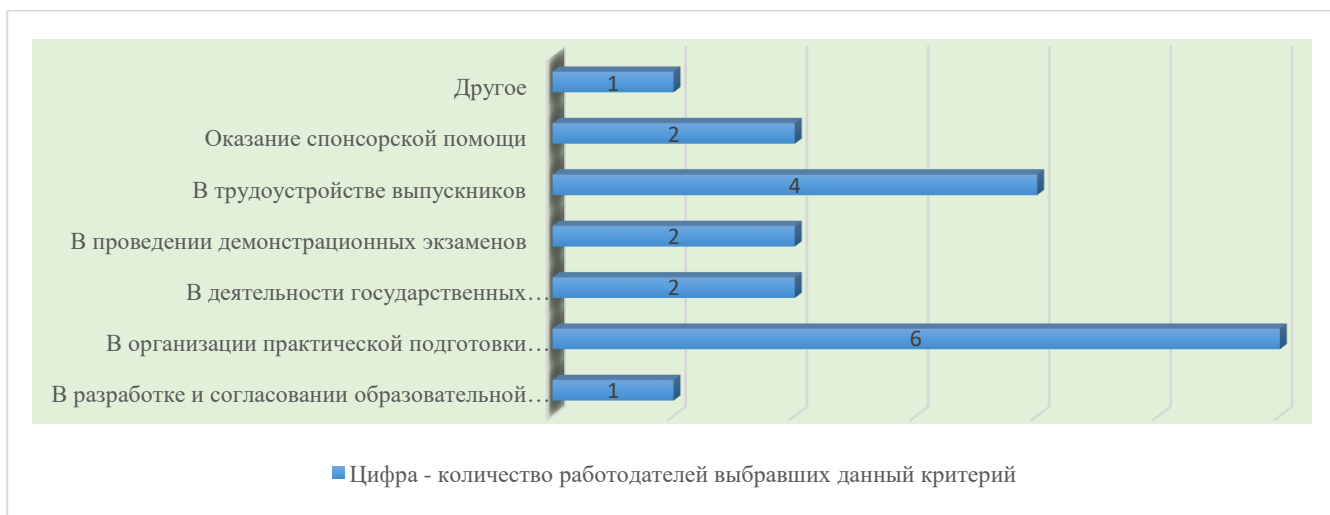
Рис. 1.1. Результаты опроса работодателей по форме участия в деятельности НТГиК

Взаимодействие организаций/предприятий с техникумом носит многосторонний характер. Предприятия реального сектора экономики участвуют в разработке и согласовании содержания образовательной программы, организации практической подготовки обучающихся техникума, в трудоустройстве выпускников; представители организаций/предприятий также участвуют в проведении демонстрационных экзаменов, деятельности государственных экзаменационных комиссий, оказании спонсорской помощи. Один представитель организации/предприятий выбрал пункт из анкеты опроса - «Другое» (без пояснения ответа). На рис. 1.1 наглядно видно активность участия организаций/предприятий в определенной области деятельности техникума.