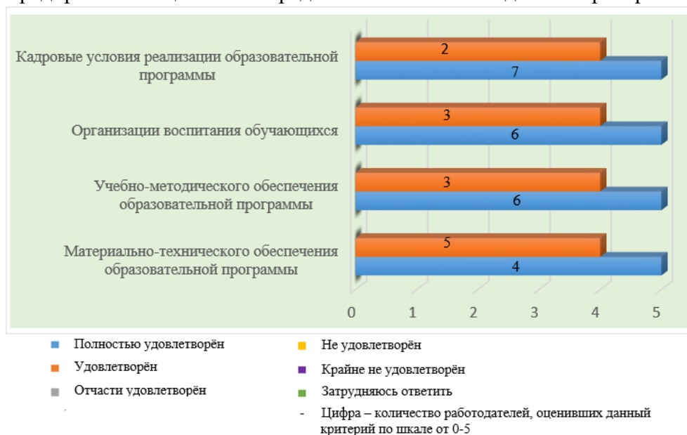
Рис. 2.1. Удовлетворенность работодателей условиям реализации образовательной программы

Работодатели организаций/предприятий достаточно удовлетворены условиями реализации образовательной программы 21.02.08 Прикладная геодезия, а именно инструментами ее реализации: материально–техническим и учебно-методическим обеспечением, организацией воспитания обучающихся, а также кадровым потенциалом. На рис. 2.1 наглядно видно количество организаций/предприятий с оценкой по предложенной шкале на данные критерии опроса анкеты.