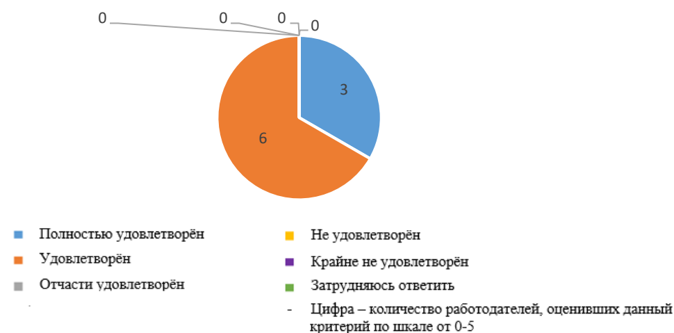
Рис. 2.11. Удовлетворенность работодателей дисциплиной и исполнительностью обучающихся (практикантов/выпускников)