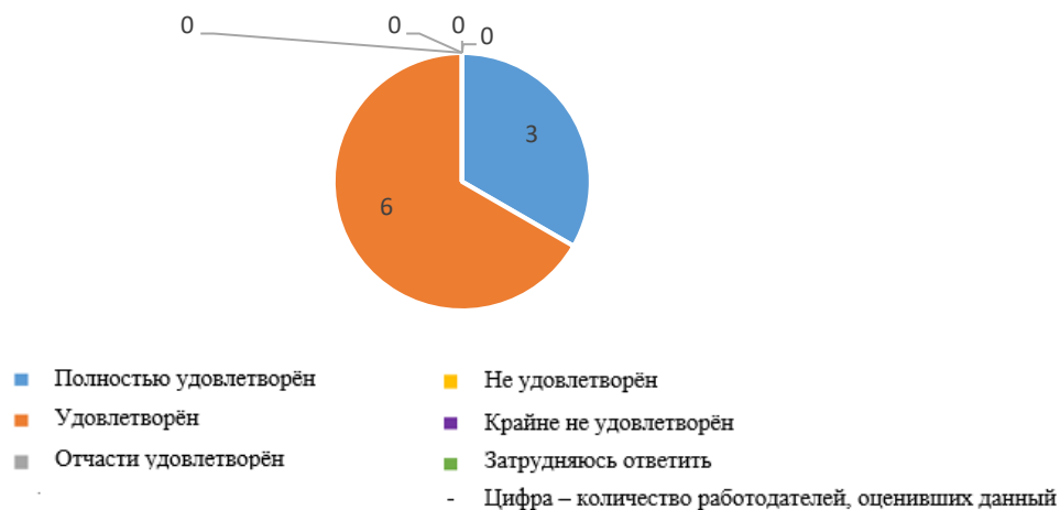
Рис. 2.3. Уровень владения профессиональными компетенциями обучающихся (практикантов/выпускников)

Уровень теоретической и практической подготовки обучающихся (практикантов/выпускников) работодателями оценен как полностью удовлетворительный или удовлетворительный (рис. 2.4 и рис. 2.5).