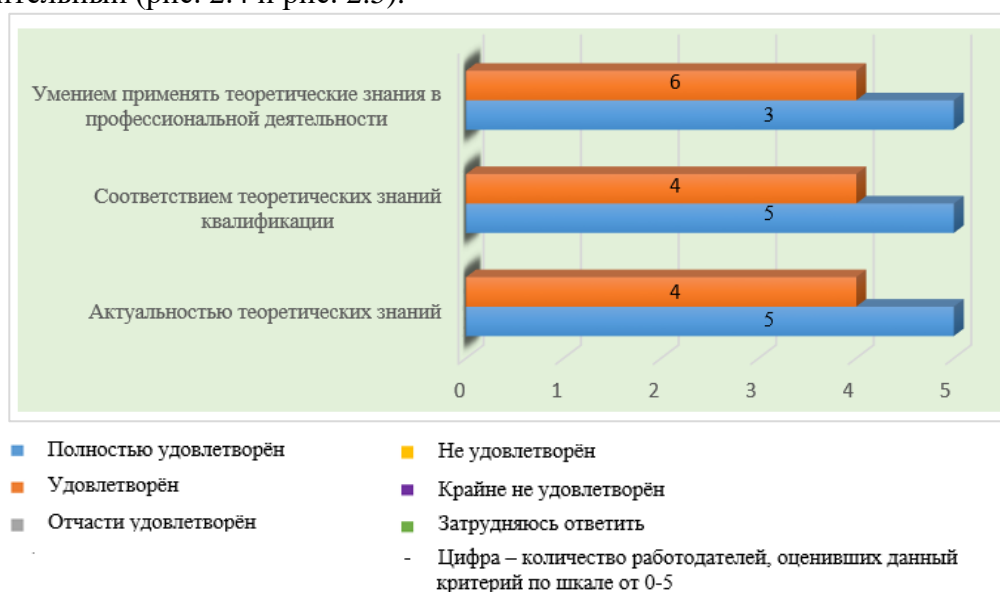
Рис. 2.4. Уровень теоретической подготовки обучающихся (практикантов/выпускников) по мнению работодателей

Уровень теоретической и практической подготовки обучающихся (практикантов/выпускников) работодателями оценен как полностью удовлетворительный или удовлетворительный (рис. 2.4 и рис. 2.5).